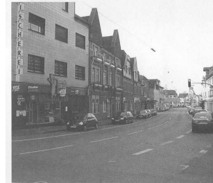
Die Bochumer Straße: Sie muss als lebendiges Zentrum Obercastrops noch sicherer und komfortabler werden — für alle Verkehrsteilnehmer.

plätze an der Viktoriastraße schaffen. Wir werden darauf achten, dass das auch wirklich geschieht. Im oberen Bereich der Bochumer Straße ist eine Parkscheibenregelung denkbar. So kann man Dauerparken zu den Geschäftszeiten vermeiden. Langfristig ist unser Ziel aber der Rückbau der Cottentburgstraße. Der Zebrastreifen sollte verlegt werden, und im unteren Bereich könnten Parkboxen die Geschwindigkeit reduzieren.